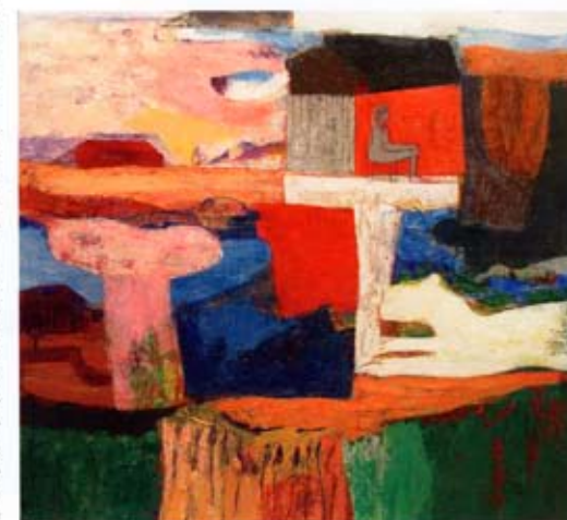
Sommarön, akryl 60x55 cm