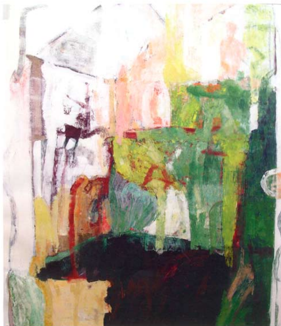
Växter, akryl, 92x90 cm