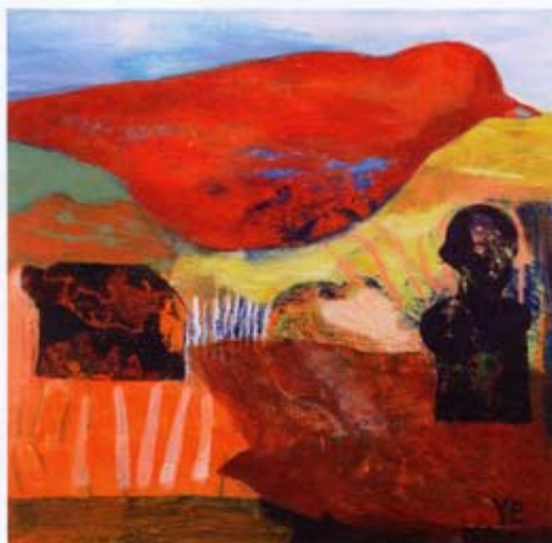
Spejare, akryl 25 x 25 cm

Yvonne Eklöf arbetar främst med akryl och väljer anfallsteknik efter bildidé och berättarlust. I både de stora målningarna och i de mindre formaten kan ytan ordnas och renas till kraftfulla halvabstrakta uttryck eller få mer upplösta former. Idag kan också människor och djur smyga sig in i bildens komposition och ge den ett annat innehåll i en bestämd berättelse. Den tidiga tystnaden och stillheten i hennes konst har numera brutits, och istället har kraftfulla former, mer markerade strukturer och en högre färgintensitet skapat en helt ny energi i hennes konst.