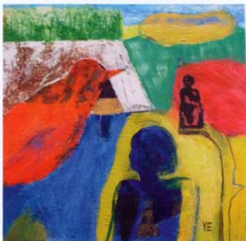
Röd sångare, akryl, 25 x 25 cm